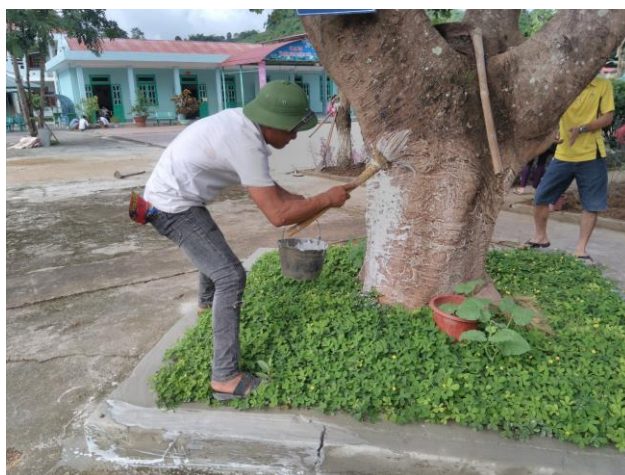
Phụ huynh học sinh chung tay cùng nhà trường đón năm học mới

Nhà trường phối hợp với cha mẹ học sinh dọn dẹp, trang trí bên ngoài, bên trong các phòng học, tạo không gian học tập thoải mái và an toàn nhất cho học sinh. Tất cả đều trang trí theo hướng mở lấy học sinh làm trung tâm với sự sáng tạo riêng, phù hợp với đặc trưng của từng lớp học, từng độ tuổi.